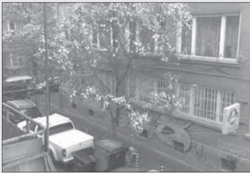
Бедняк рови в кофа за боклук в центъра на София под първия сняг, който преди това премина през два стадия - дъжд и суграшица. Зимата подрани и след като само преди 8 дни температурите в страната бяха 30 градуса, сега се очаква живакът да падне до минус 7. Вчера в 11 области в Източна България бе обявен код Жълто

ректора на гружеството Стоян Цветанов обясни, че решението