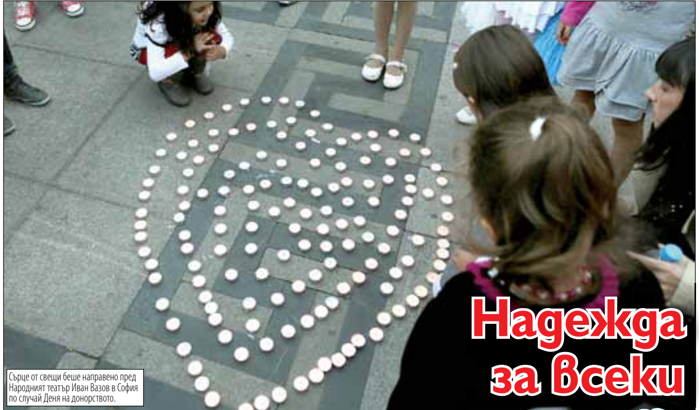
Сърце от свещи беше направено пред Народният театър Иван Вазов в София по случай Деня на донорството.