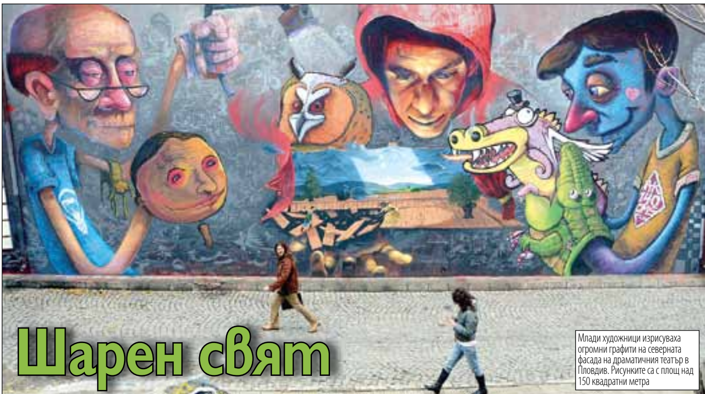
Млади художници изрисоваха огромни графити на северната фасада на драматичния театър в Пловдив. Рисунките са с площ над 150 квадратни метра