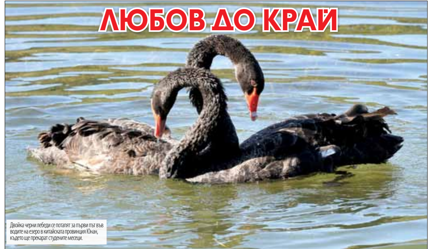
Двойка черни лебеди се потапят за първи път във водите на езеро в китайската провинция Юнан, където ще прекарат студените месеци.