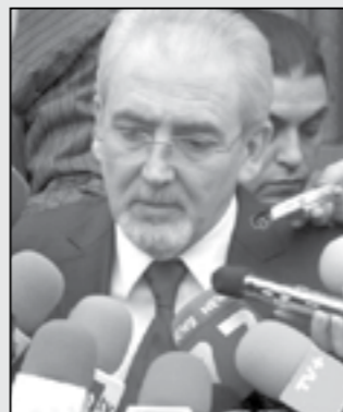
към министър-председателя Пламен Орешарски, смятам

„Единственият политически ангажимент, който съм поел, е