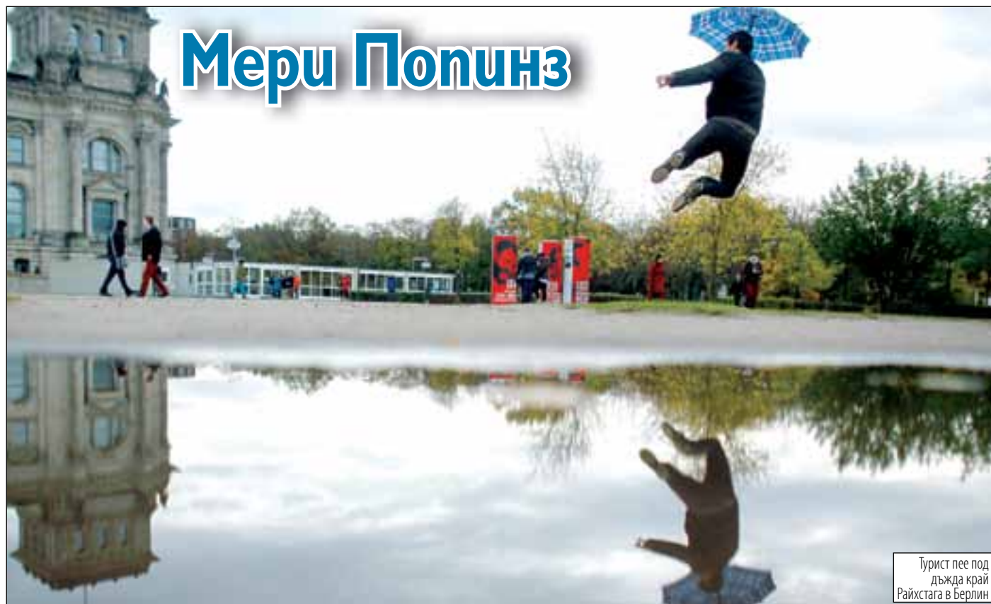
Турист пее под дъжда край Райхстага в Берлин