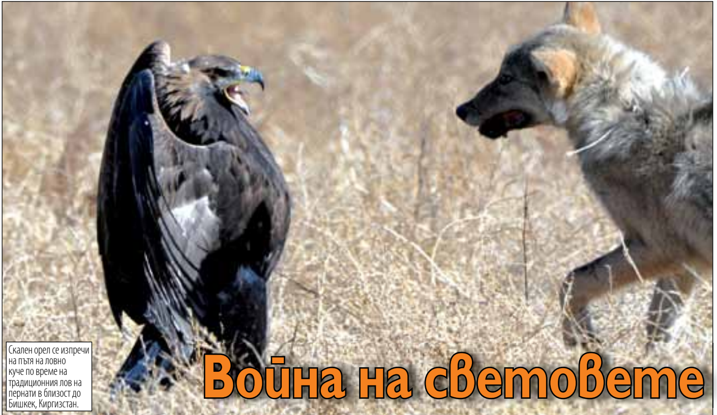
Скален орел се изпречи на пътя на ловно куче по време на традиционния лов на пернати в близост до Бишкек, Киргизстан.