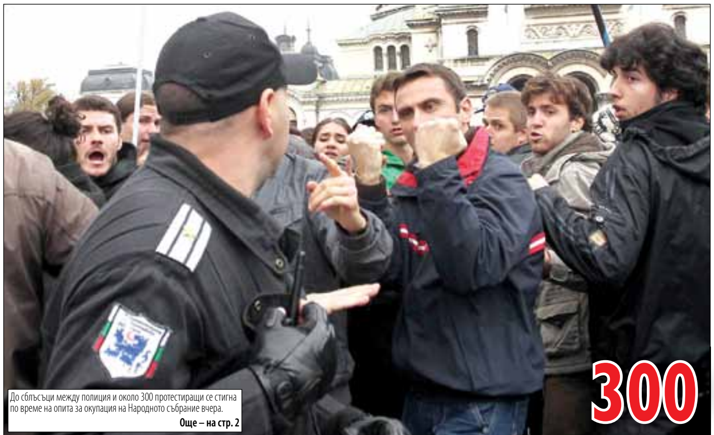
До сблъсъци между полиция и около 300 протестиращи се стигна по време на опита за окупация на Народното събрание вчера.