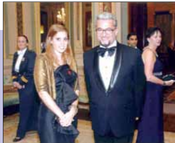
Евгени Минчев и принцеса Беатрис на бал

в къщата на Грузия ден влезе лекар. Слава Богу, намести я и не се стигна до операция“, каза още Рагева. „Живя с борец, но такова нещо не съм виждала“, допълни тя.