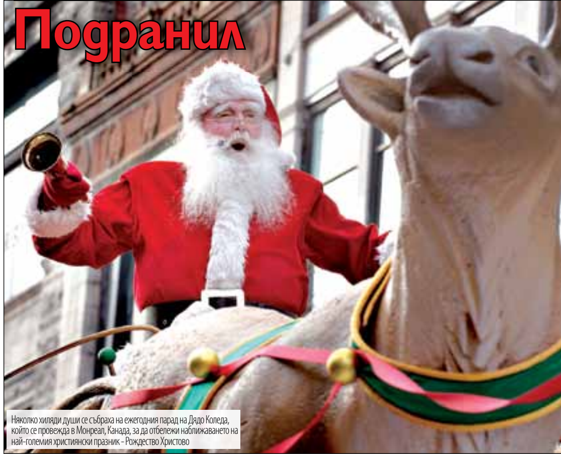
Няколко хиляди души се събраха на ежегодния парад на Дядо Коледа, който се провежда в Монреал, Канада, за да отбележи приближаването на най-големия християнски празник – Рождество Христово