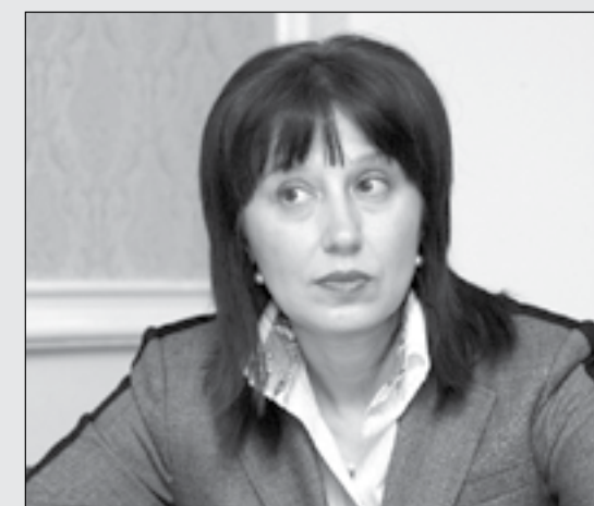
английските власти, и в частност на министър Дейвид Уилетс, са дискриминационни.