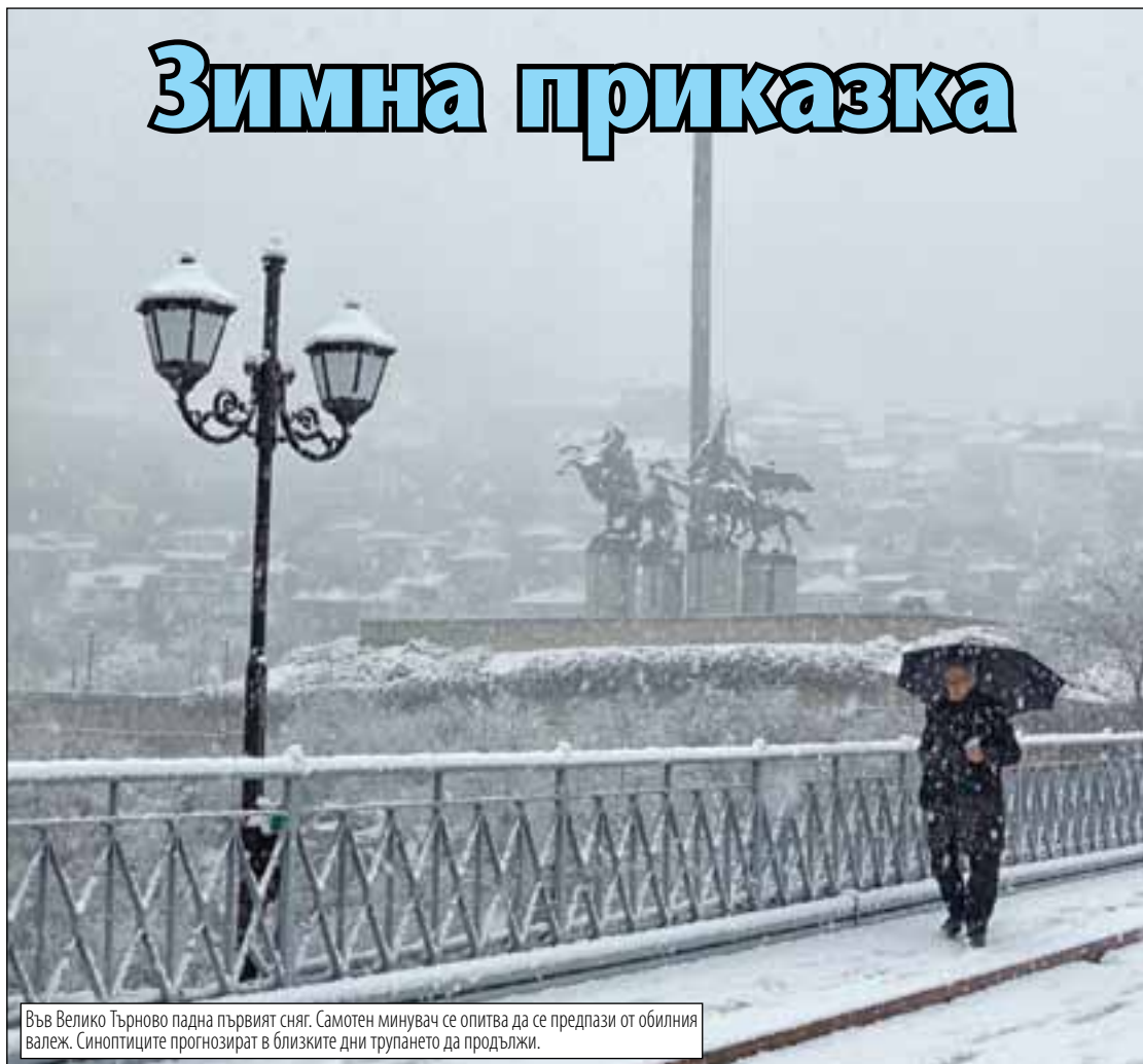
Във Велико Търново падна първият сняг. Самотен минувач се опитва да се предпази от обилния валеж. Синоптиците прогнозираят в близките дни трупането да продължи.

>>АВТОРКАТА НА ПЛАКАТИТЕ НА УМНИТЕ И КРАСИВИТЕ ЯРА БУБНОВА СЕ ОБЛАЖИ С ЧУДЕН ПОСТ