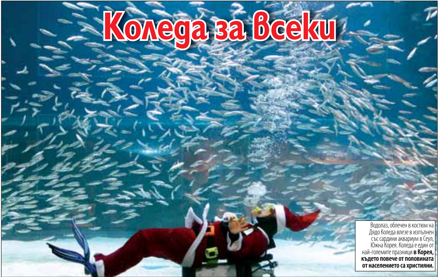
Водолаз, облечен в костюм на Дядо Коледа влезе в изпълнен със сардини аквариум в Сеул, Южна Корея. Коледа е един от най-големите празници в Корея, където повече от половината от населението са християни.