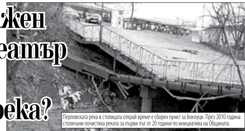
Перловската река в столицата открай време е сборен пункт за боклуци. През 2010 година столичани почистиха реката за първи път от 20 години по инициатива на Общината.

„За празниците не са оставали хора на улицата, затова тази година разкрихме и втори кризисен център“, добави още Владимирова.