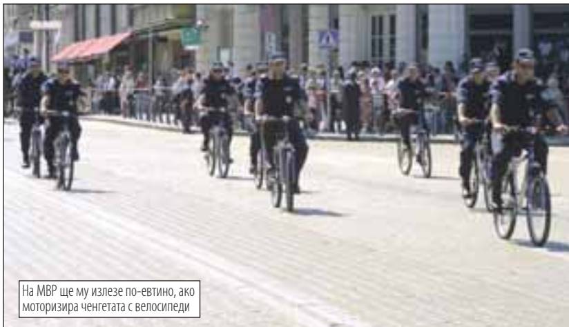
На МВР ще му излезе по-евтино, ако моторизира ченгетата с велосипеди

„ДАНС също ще имат едно леко ограничаване на бюджета, с който са разполагали досега, също и Министерство на отбраната, за да може действително да се пренасочат тези средства към сектори, които се явяват като приоритет за следващата година“, каза Цветанов в Министерския съвет. Той