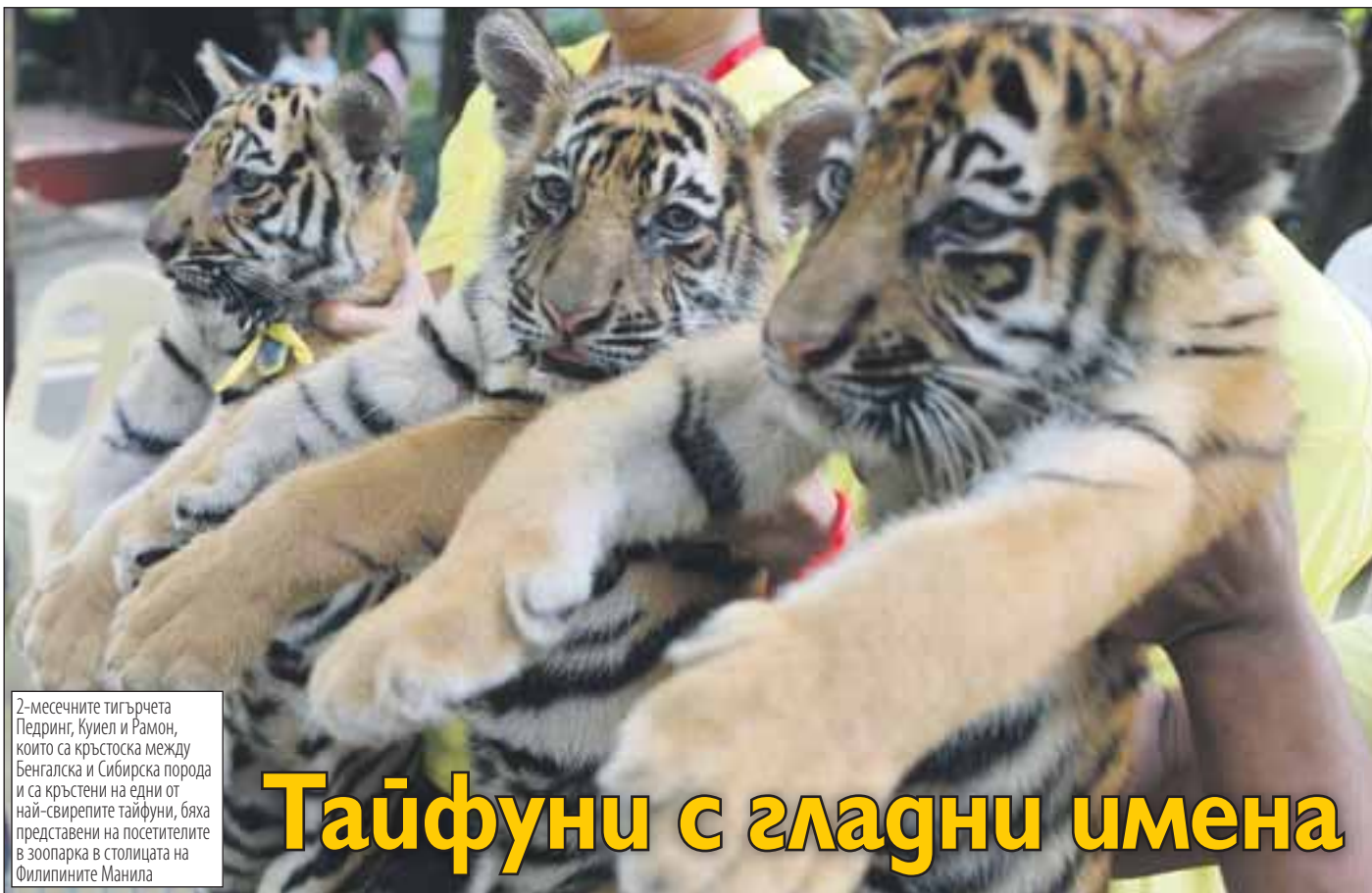
2-месечните тигърчета Педринг, Куиел и Рамон, които са кръстоска между Бенгалска и Сибирска порода и са кръстени на едни от най-свирепите тайфуни, бяха представени на посетителите в зоопарка в столицата на Филипините Манила