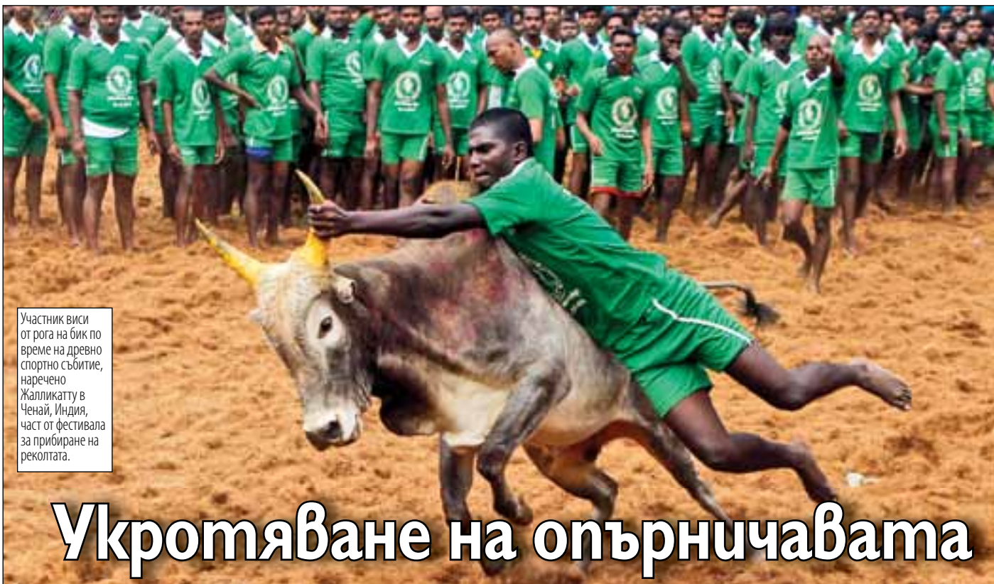
Участник виси от рога на бик по време на древно спортно събитие, наречено Жалликату в Ченай, Индия, част от фестивала за прибиране на реколтата.