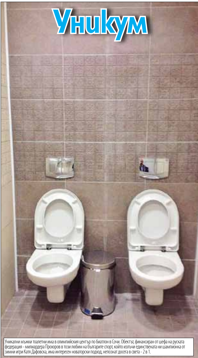
Уникални мъжки тоалетни има в олимпийския център по биатлон в Сочи. Обектът, финансиран от шефа на руската федерация - милиардера Прохоров в този любим на българите спорт, който излъчи единствената ни шампионка от зимни игри Катя Дафовска, има интересен новаторски подход, непознат досега в света - 2 в 1.