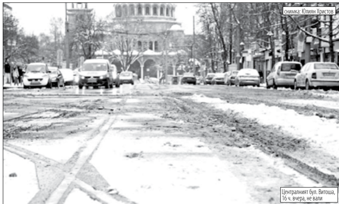
Централният бул. Витоша, 16 ч. вчера, не вали