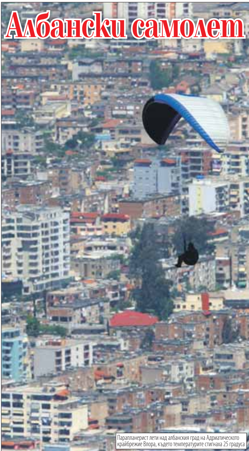
Парапланерист лети над албанския град на Адриатическото крайбрежие Влора, където температурите стигнаха 25 градуса