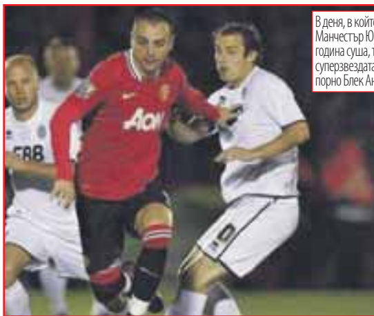
В деня, в който Бербо се отпуща за Манчестър Юнайтед след половин година суша, той бе пожелан от суперзвездата на европейското порно Блек Анджелика

Суперзвездата на българския футбол Димитър Бербатов най-после се отпуща, след като вкара гол и записа асистенция за победата на Манчестър Юнайтед с 3:0 при гостуването на 4-дивизионния Алдършот в 1/8-финала за Карлинг Къп в навечерието на имения си ден. 30-годишният бивш капитан на националния ознаменува 100-ия си мач като титуляр с екипа на Червените дяволи, разписвайки се в 15-ата минута. Бербо не беше опъвал мрежата на съперник в официална среща от 9 април, когато бе точен за успеха с 2:0 над Фулъм във Висшата лига. Попадението на Рикриейшън Граунд пред 7044 зрители бе негово 48-о с