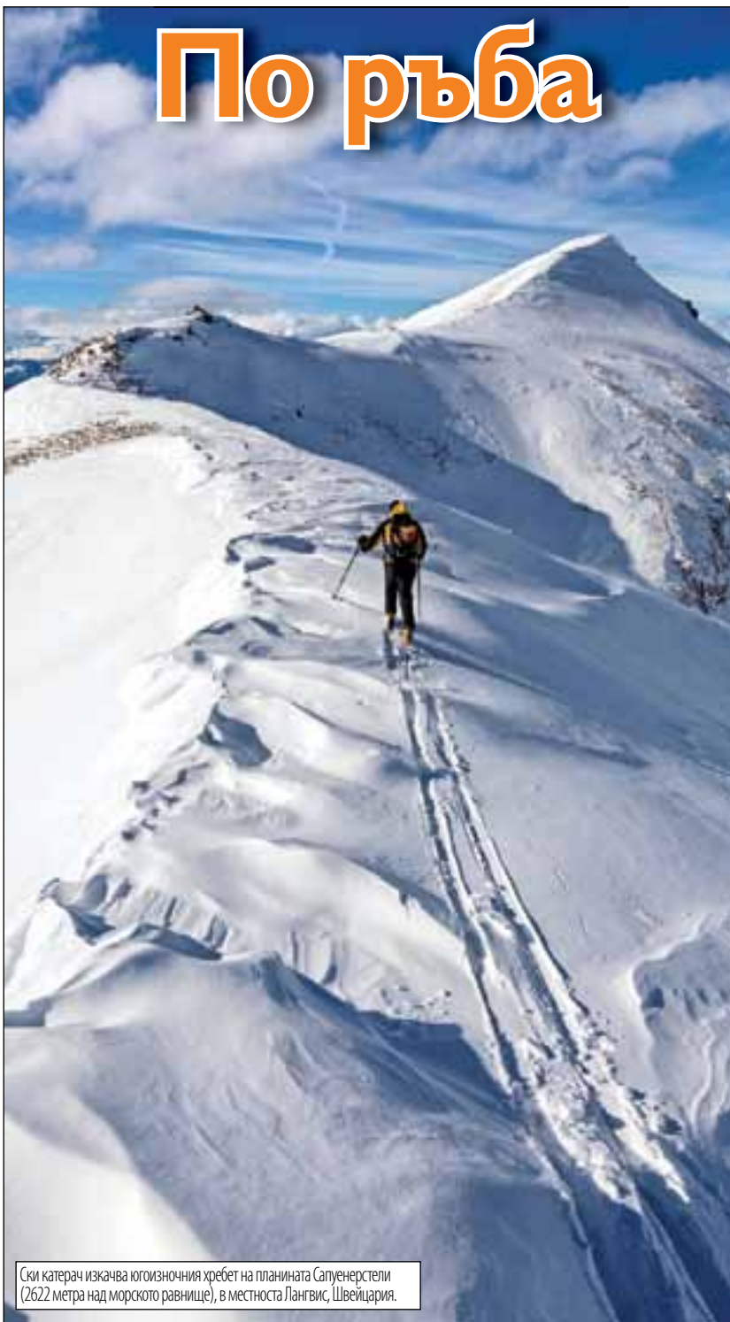
Ски катарач изкачва югоизточния хребет на планината Сапуенерстели (2622 метра над морското равнище), в местността Лангвис, Швейцария.