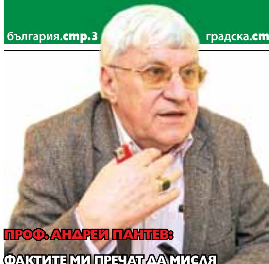
ПРОФ. АНАРЕИ ПАНТЕВ: ФАКТИТЕ МИ ПРЕЧАТ ДА МИСЛЯ