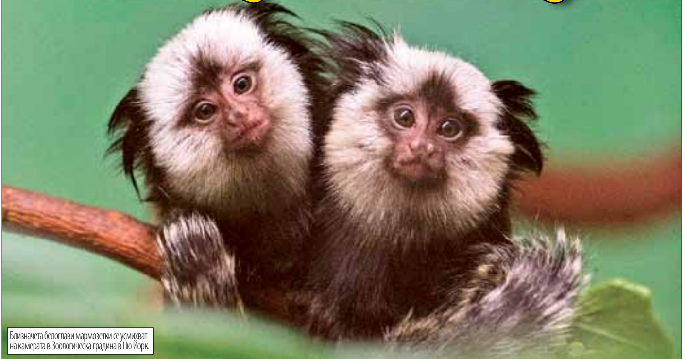
Близначета белоглави мармозетки се усмихват на камерата в Зоологическа градина в Ню Йорк.