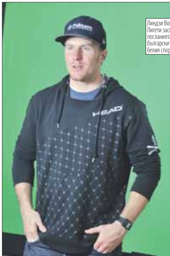
Линдзи Вон и Тед Лигети заснемат посланията си към българските фенове на белия спорт.

чески и с факта, че за пръв път наш зимен курорт приема събитие и от мъжката, и от женската програма в рамките на един сезон! Сред официалните спонсори на мъжкото състезание е Diners Club International, а на женското - Fibank. Очаквайте тв клипа с посланията на най-елитните скиори в национален ефир и в интернет към края на годината.