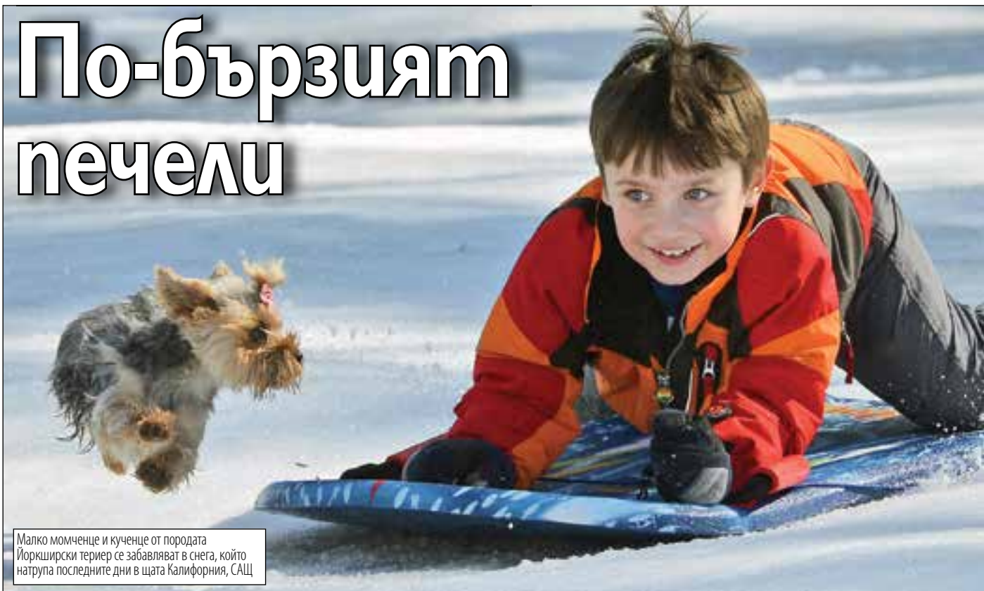
Малко момченце и кученце от породата Йоркширски териер се забавляват в снега, който натрупа последните дни в щата Калифорния, САЩ