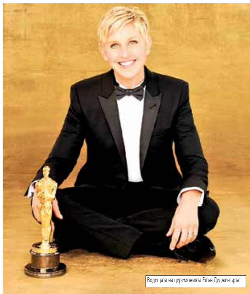
Водещата на церемонията Елън ДеДженеръс