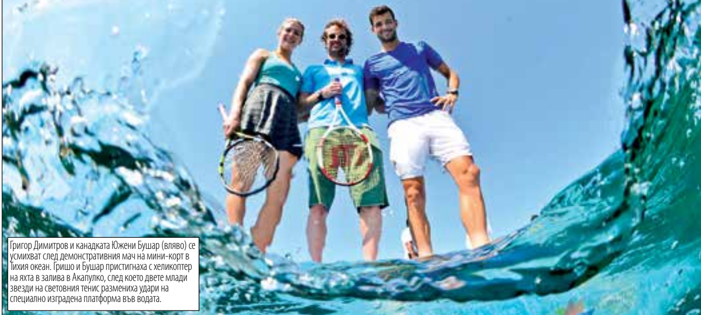
Григор Димитров и канадката Южени Бушар (вляво) се усмихват след демонстративния мач на мини-корт в Тихия океан. Гришо и Бушар пристигнаха с хеликоптер на яхта в залива в Акапулко, след което двете млади звезди на световния тенис размениха удари на специално изградена платформа във водата.