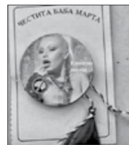
фолкгърли. „Първо започнаха с

Нова мода сред мартениците възмути хиляди столичани. Както всяка година, в последните дни от февруари София е залята от безброй малки сергийки, продаващи мартеници. Тази година масово на пазара плъзнаха украшения с ликовите на голи