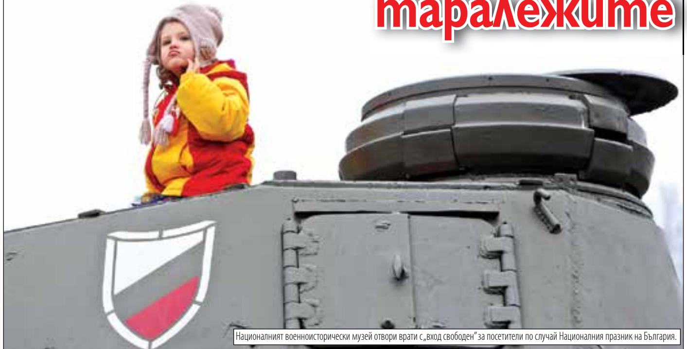
Националният военноисторически музей отвори врати с „вход свободен“ за посетители по случай Националния празник на България.