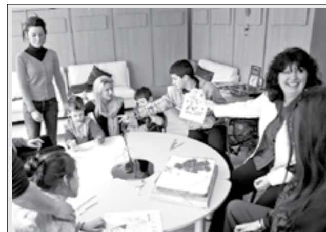
СЛЕДВАЙКИ ИЗГРАДЕНАТА ВЕЧЕ ТРАДИЦИЯ, ЕКИПЪТ НА КЕМПИНСКИ ХОТЕЛ ЗОГРАФСКИ СОФИЯ ЧЕСТИТИ БАБА МАРТА НА ДЕЦАТА ОТ ДНЕВЕН ЦЕНТЪР ЗА ДЕЦА С УВРЕЖДАНЯ Св. ВРАЧ СЪС СПЕЦИАЛНА ТОРТА-МАРТЕНИЦА.

„Поздравяваме инициаторите. Всеки трябва да има кауза. Надяваме се още хора да се включат в кампанията“, казаха абитуриентите от 18 СОУ. Припомняме, че миналата седмица тазгодишният випуск на Втора английска гимназия в София заяви, че се отказва от скъпите рокли и костюми за бала в името на едно по-добро бъдеще за т.нар. Пеперудени деца. В социалната мрежа Фейсбук се появи и група Панаир на добрината, която набира все повече почитатели.