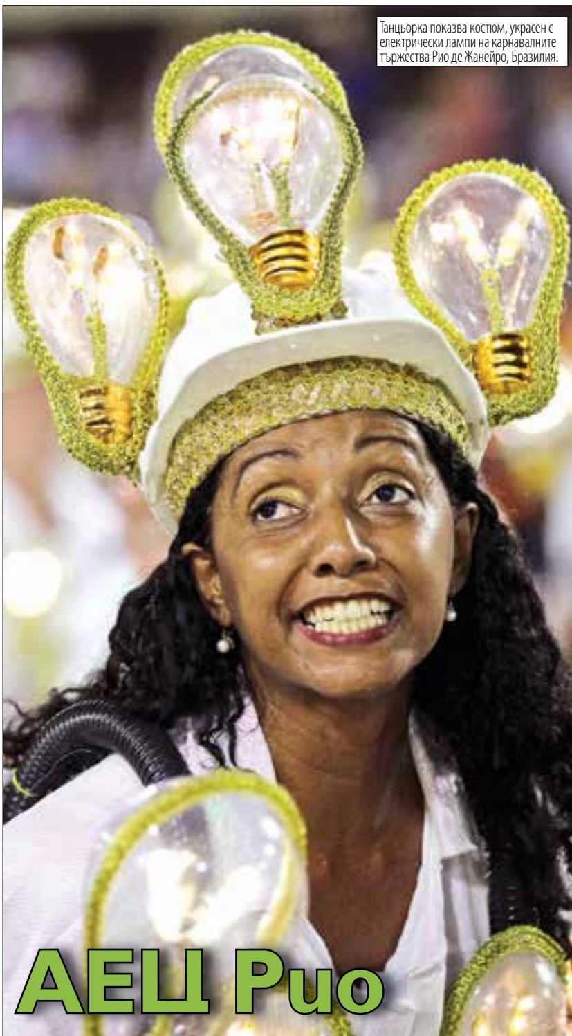
Танцьорка показва костюм, украсен с електрически лампи на карнавалните тържества Рио де Жанейро, Бразилия.