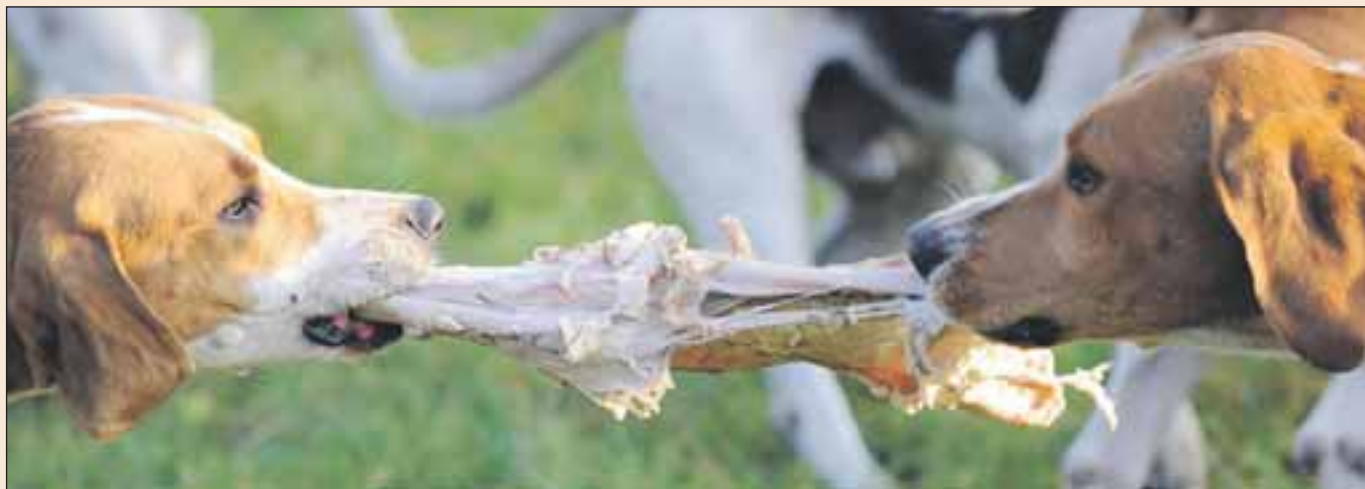
Хрътки от Долна Саксония са се съборили за кокала по време на традиционните гонки в Берлингер (Гер). 52 кучета трябваше да преодолеят 30 препятствия по 15-километровото трасе