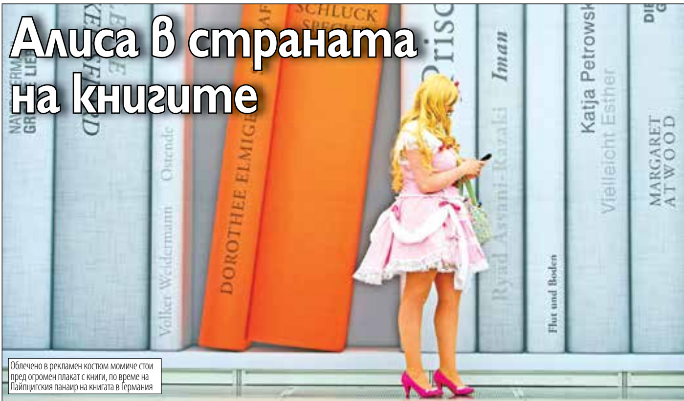
Облечено в рекламен костюм момиче стои пред огромен плакат с книги, по време на Лайпцигския панаир на книгата в Германия