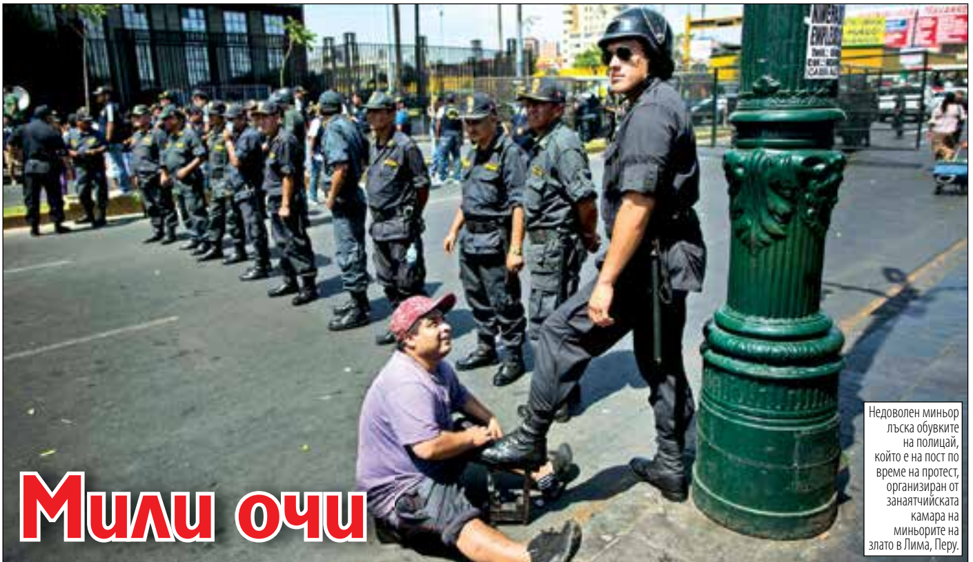
Недоволен миньор лъска обувките на полицаи, който е на пост по време на протест, организиран от занаятчийската камера на миньорите на злато в Лима, Перу.