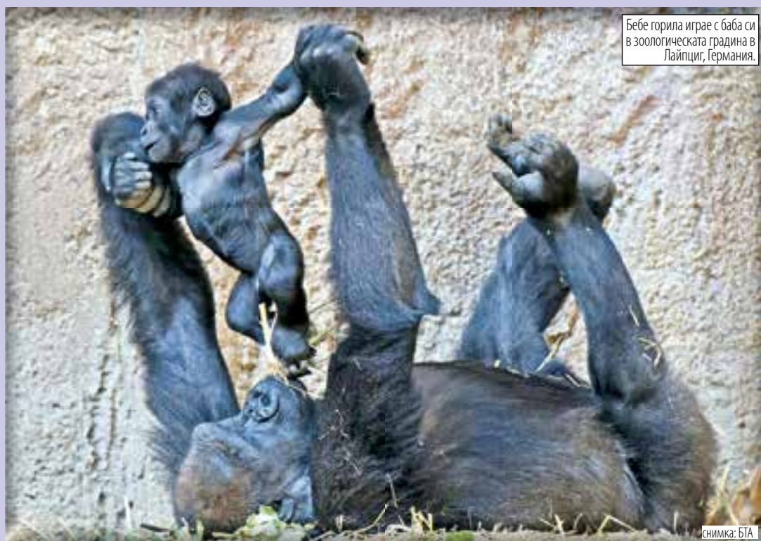
Бебе горила играе с баба си в зоологическата градина в Лайпциг, Германия.