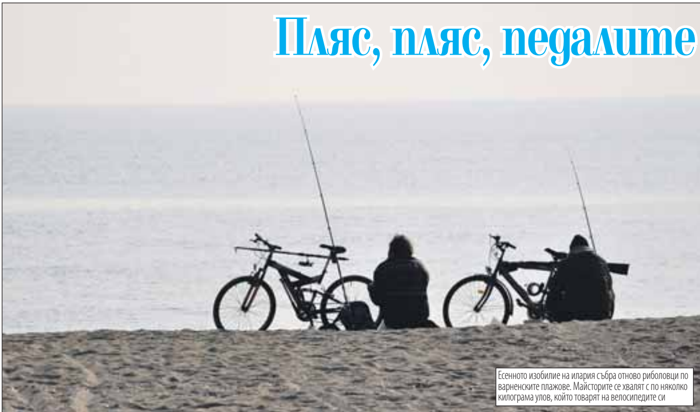
Есенното изобилие на илария събра отново риболовци по варненските плажове. Майсторите се хвалят с по няколко килограма улов, който товарят на велосипедите си