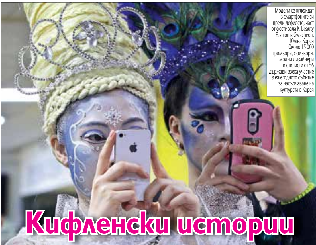
Модели се оглеждат в смартфоните си преди дефилето, част от фестивала K-Beauty Fashion в Gwacheon, Южна Корея. Около 15 000 гримьори, фризьори, модни дизайнери и стилисти от 56 държави взеха участие в ежегодното събитие за насърчване на културата в Корея.