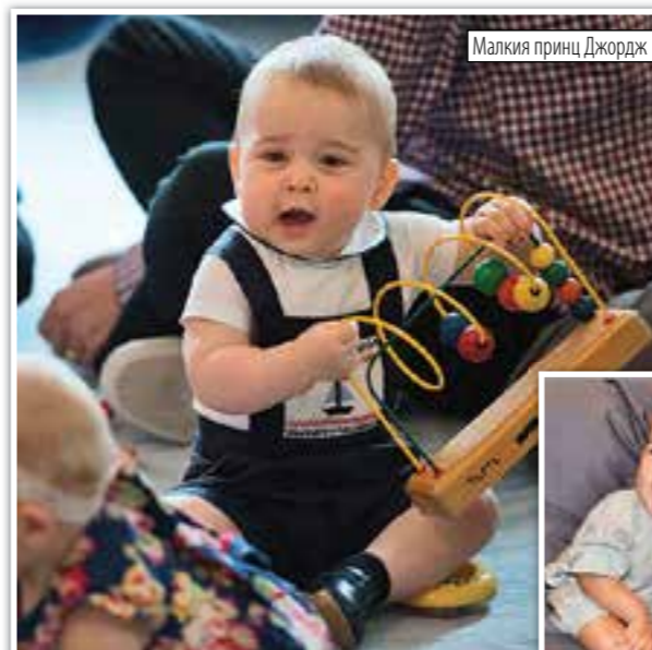
Малкия принц Джордж