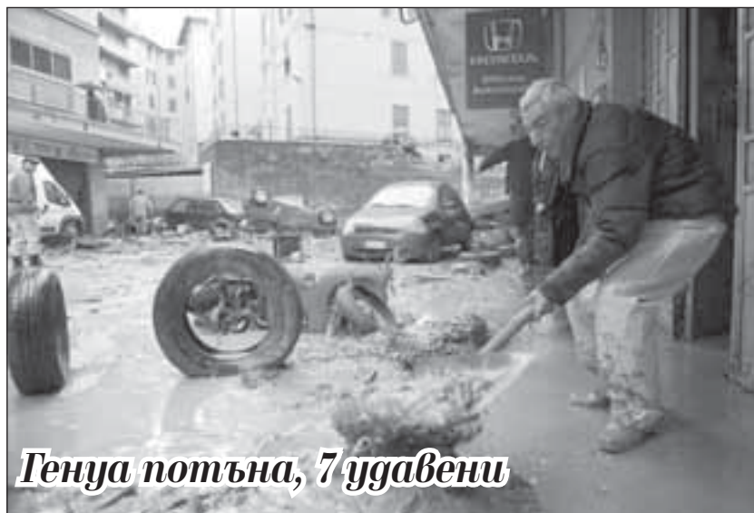
Генуа потъна, 7 удавени