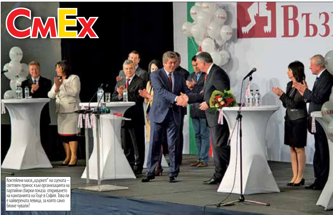
Коктейлни маси „щъркел“ на сцената – световен принос към организацията на партийни сбирки показва откриването на кампанията на Гоце в София. Това ли е хайверената левица, за която само бяхме чували?