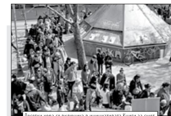
Десетки хора се включиха в инициативата Книги за смет миналата година на столичния площад Славейков

съботния следобед на бул. Витоша. Инициативата на гимнастиците е част от събитията, съпътстващи провеждането на шампионата, на който София ще бъде домакин от 12 до 25 май. Събитието ще събере над 600 състезатели от цяла Европа и ще бъде отразено от водещи медии в целия свят, сред които са потвърдили присъствие дори журналисти от САЩ и Афганистан.