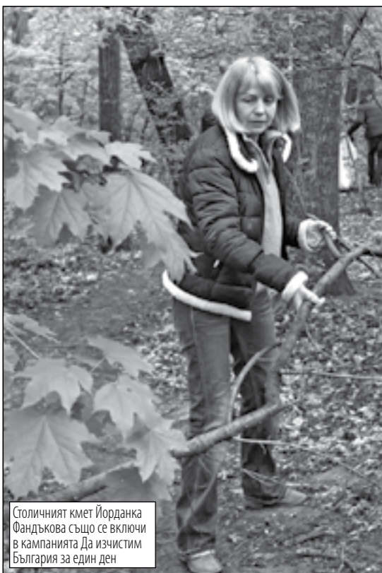
Столичният кмет Йорданка Фандъкова също се включи в кампанията Да изчистим България за един ден

Инициативата Да изчистим България за един ден, дублираща Ленинските съботници от соца, стартира през пролетта на 2011 година и всяка година в нея участие вземат все повече хора. Общото количество на извозения боклук тази година е близо 14 000 тона.