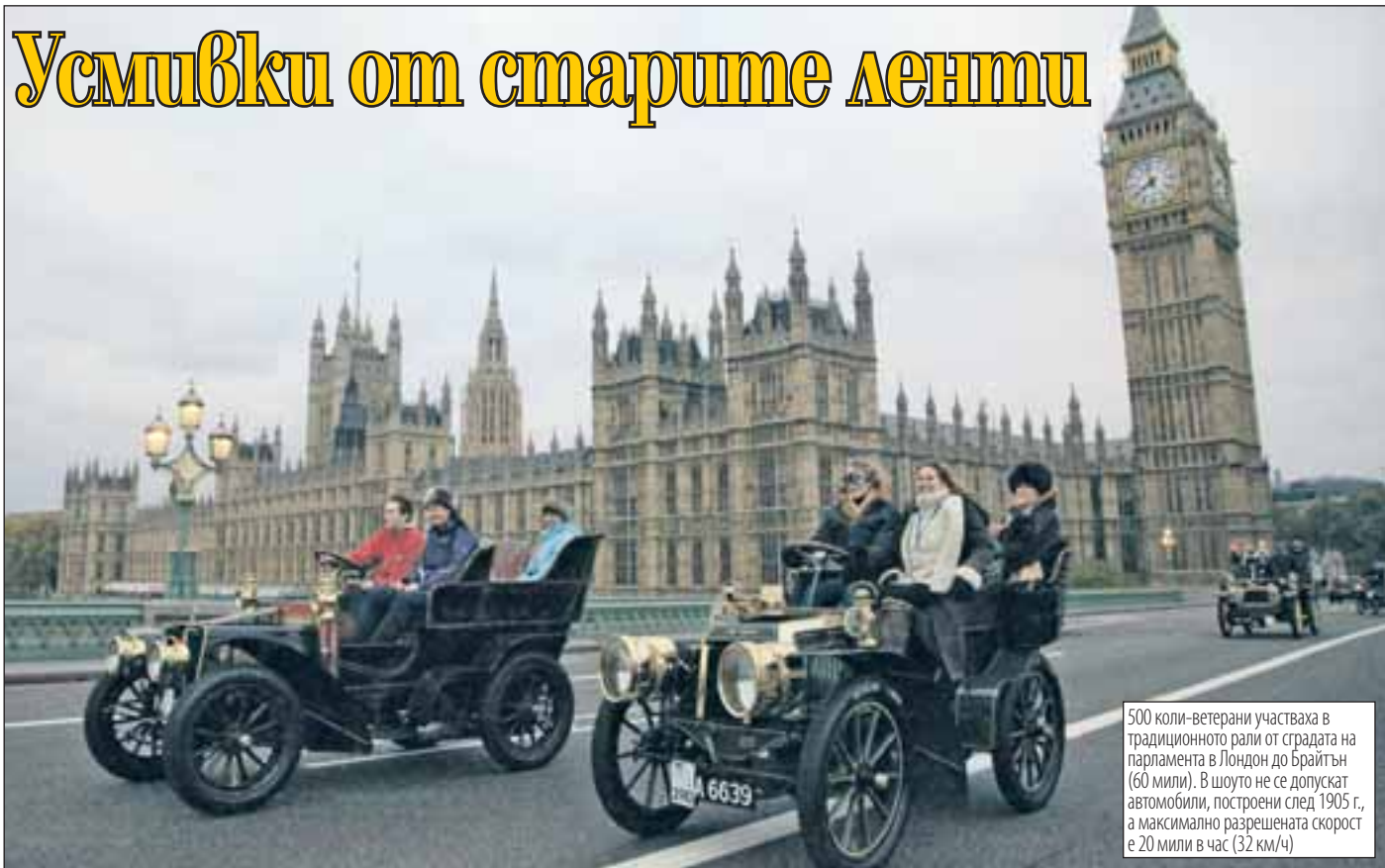
500 коли-ветерани участваха в традиционното рали от сградата на парламента в Лондон до Брайтън (60 мили). В шоуто не се допускат автомобили, построени след 1905 г., а максимално разрешената скорост е 20 мили в час (32 км/ч)