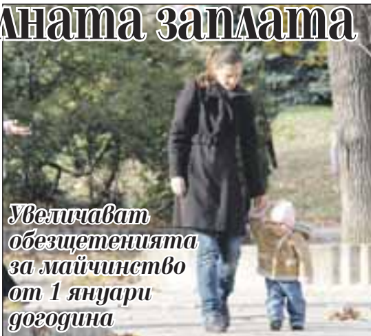
Увеличават обезщетенията за майчинство от 1 януари догодина

„Стига да има средства, трябва да се започне вдигането на най-ниските пенсии на хората, които в момента са икономически затруднени“, каза председателят на Българската търговско-промишлена палата (БТПП) Цветан Симеонов.