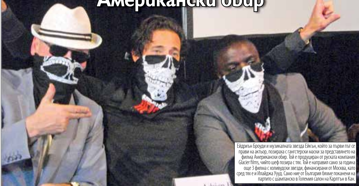
Ейдриън Броуди и музикалната звезда Ейкън, който за първи път се прави на актьор, позираха с гангстерски маски за представянето на филма Американски обир. Той е продуциран от руската компания Glacier films, чийто шеф позира с тях. Той е направил само за година още 3 филма с холивудски звезди, финансирани от Москва, като сред тях е и Илайджа Ууд. Само ние от България бяхме поканени на партито с шампанско в Големия салон на Карлтън в Кан.