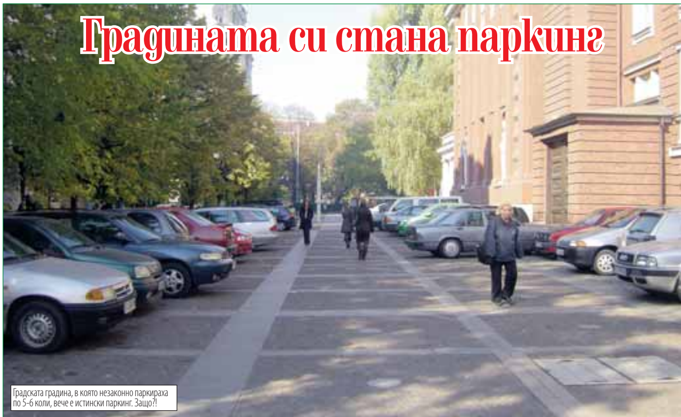
Градската градина, в която незаконно паркираха по 5-6 коли, вече е истински паркинг. Защо?!