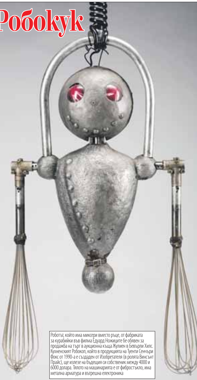
Роботът, който има миксери вместо ръце, от фабриката за курабийки във филма Едуард Ножиците бе обявен за продажба на търг в аукционна къща Жулиен в Бевърли Хилс. Кухненският Робокук, който в продукцията на Тунти Сенчъри Фокс от 1990-а е създаден от Изобретателя (в ролята Винсънт Прайс), ще излезе на бъдещия си собственик между 4000 и 6000 долара. Тялото на машинариата е от фибростъкло, има метална арматура и вътрешна електроника