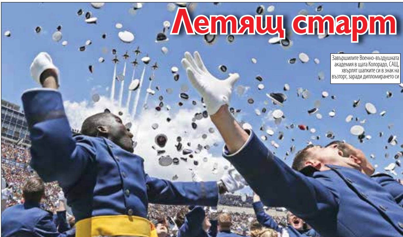
Завършилилите Военно-въздушната академия в щата Колорадо, САЩ, хвърлят шапките си в знак на възторг, заради дипломирането си