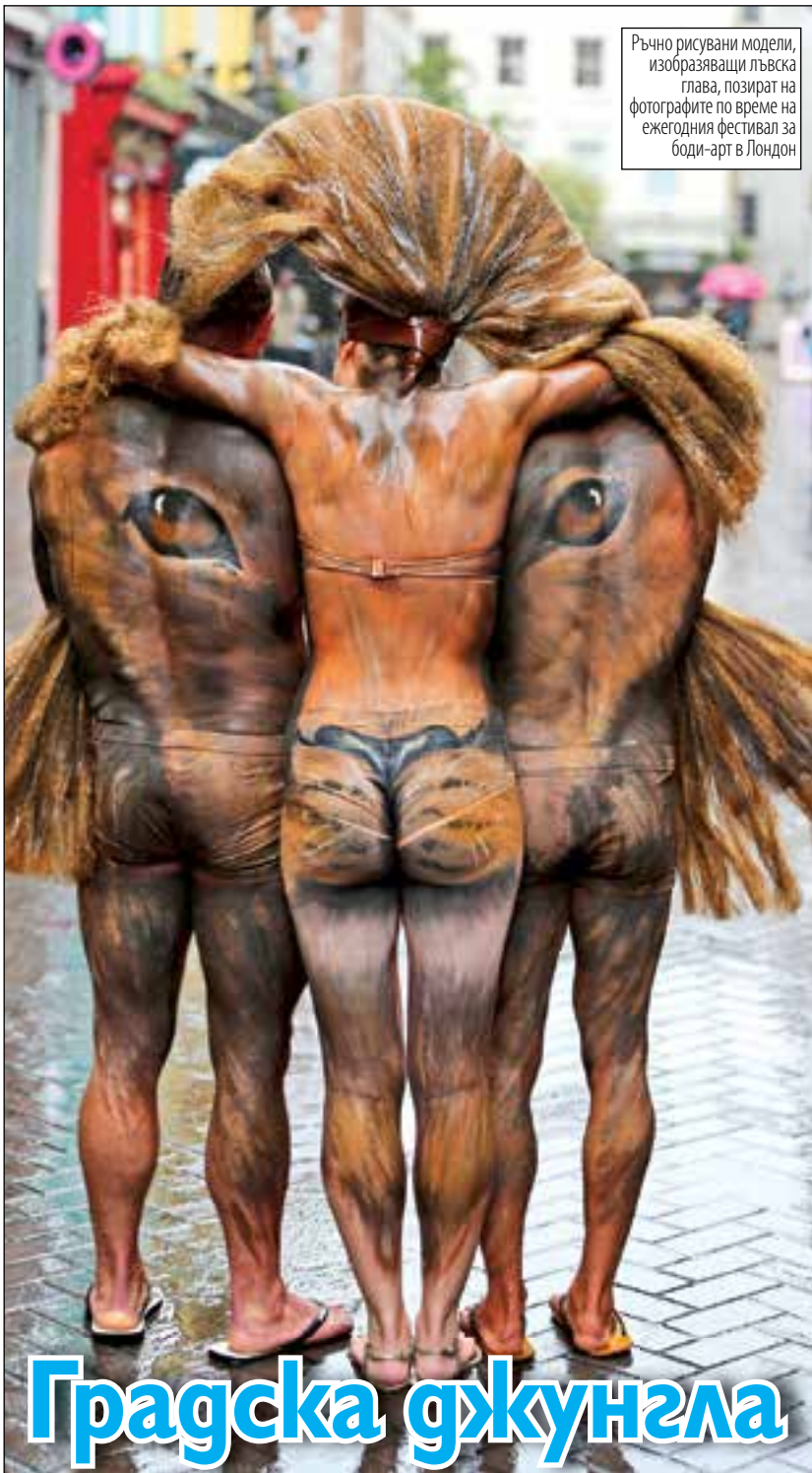
Ръчно рисувани модели, изобразяващи лъвска глава, позират на фотографите по време на ежегодния фестивал за боди-арт в Лондон