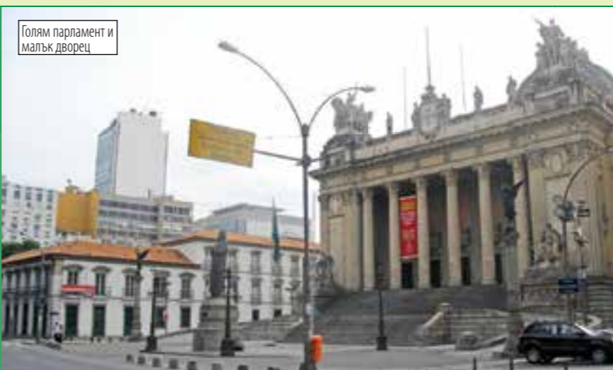
Голям парламент и малък дворец

Всичко това е гръбнак за най-голямата икономика на континента. Бразилия дава 5/5 или 60% от цялата индустриална продукция на цяла Южна Америка. Иначе казано това са 2,5 трилиона долара и резерв от други 550 млрд. в зелено. Ръстът тази година ще бъде съ-