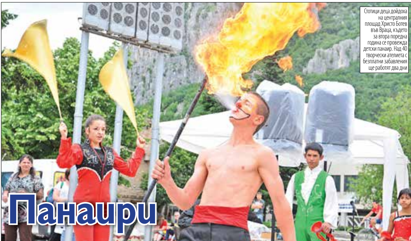
Стотици деца дойдоха на централния площад Христо Ботев във Враца, където за втора поредна година се провежда детски панаир. Над 40 творчески ателиета с безплатни забавления ще работят два дни