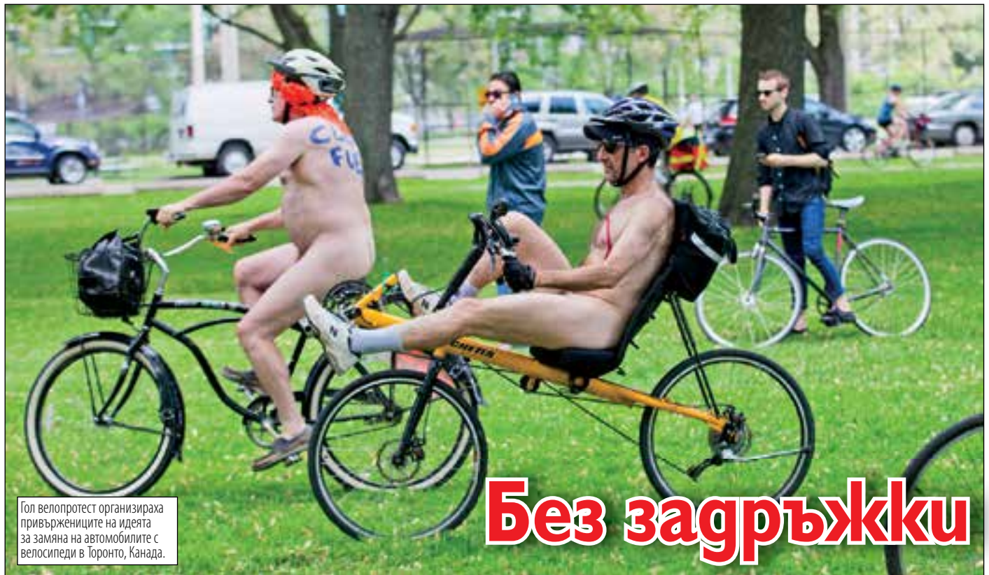
Гол велопротест организираха привържениците на идеята за замяна на автомобилите с велосипеди в Торонто, Канада.