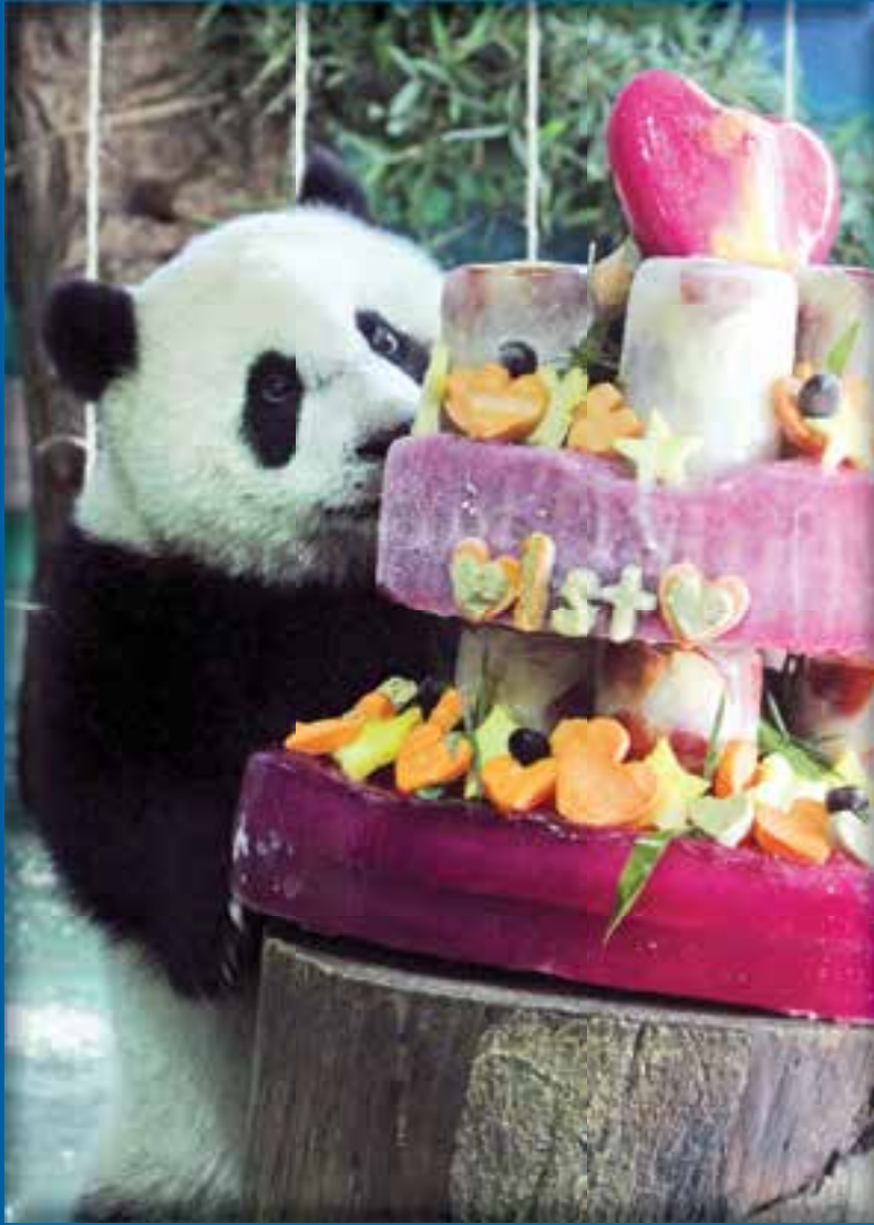
Тайванската панда Йо Зай празнува своя първи рожден ден в Зоопарка в Тайпе. Мечето е родено в зоологическата градина, а родителите Туан Туан и Иуан Иуан са родом от Китай.