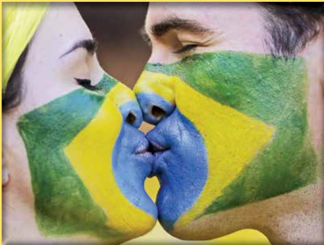
Вчера беше международният ден на целувката. Привържениците на бразилския национален отбор по футбол се не пропуснаха да отбележат подобаващо случая.