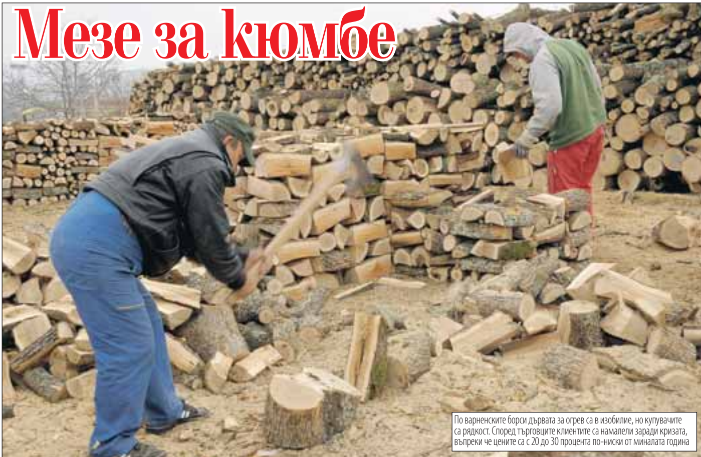
По варненските борси дървата за огрев са в изобилие, но купувачите са рядкост. Според търговците клиентите са намалели заради кризата, въпреки че цените са с 20 до 30 процента по-ниски от миналата година