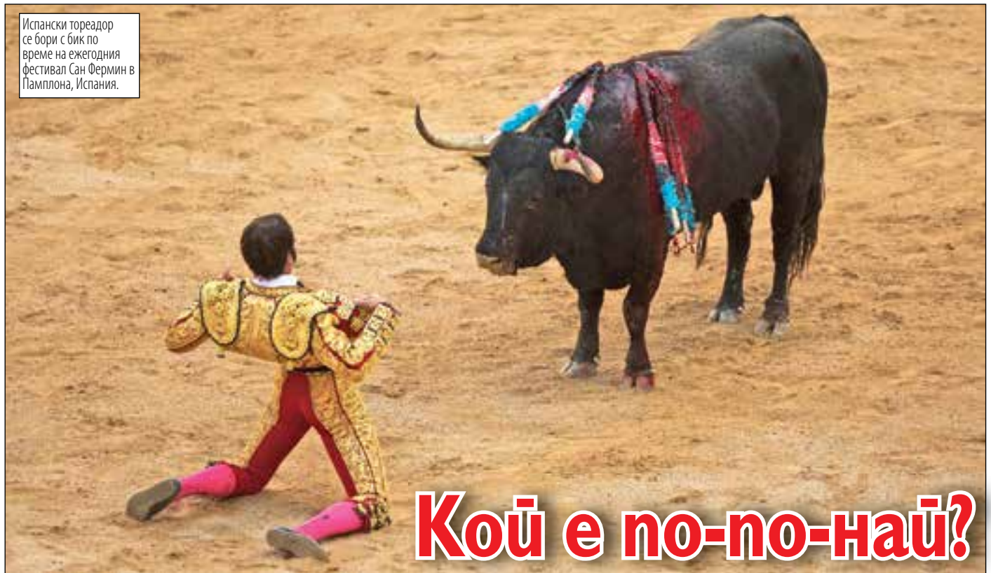
Испански тореадор се бори с бик по време на ежегодния фестивал Сан Фермин в Памплона, Испания.