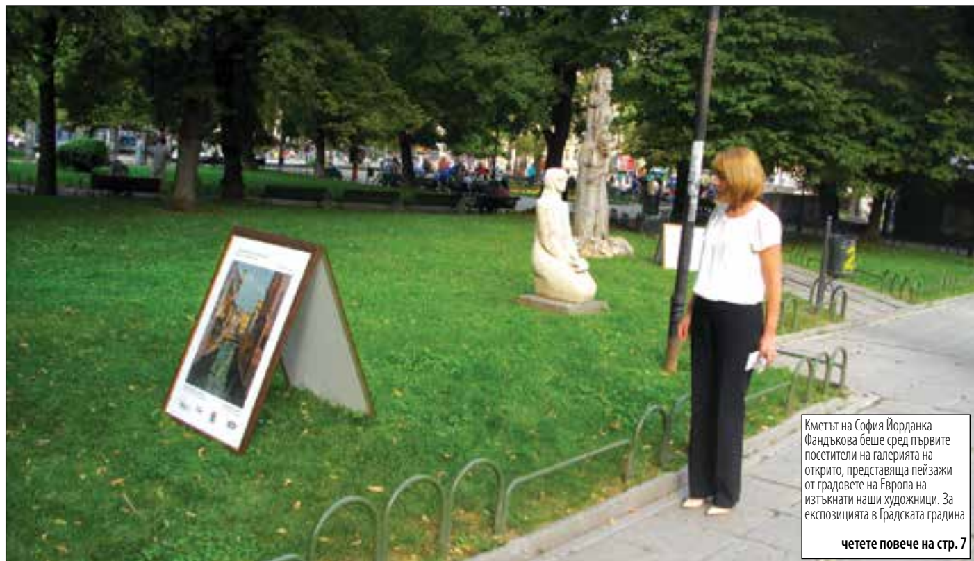
Кметът на София Йорданка Фандъкова беше сред първите посетители на галерията на открито, представяща пейзажи от градовете на Европа на изтъкнати наши художници. За експозицията в Градската градина четете повече на стр. 7