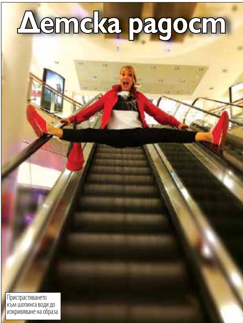
Пристрастяването към шопинга води до изкривяване на образа