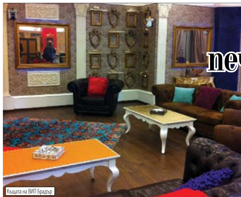
Къщата на VIP Брадър