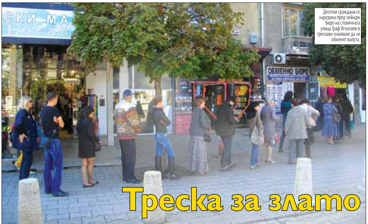
Десетки граждани се наредиха пред чейндж бюро на столичната улица Граф Игнатиев в трескаво очакване да си обменят валута.

>>ВАРНЕНСКИТЕ КАНДИДАТИ ВЪВ ВОЙНА ЗАРАДИ ПРЕФЕРЕНЦИИ И АСЕН ДИМИТРОВ - ДЕБЕЛИЯ БЪЛГАРИЯ.сmp.2