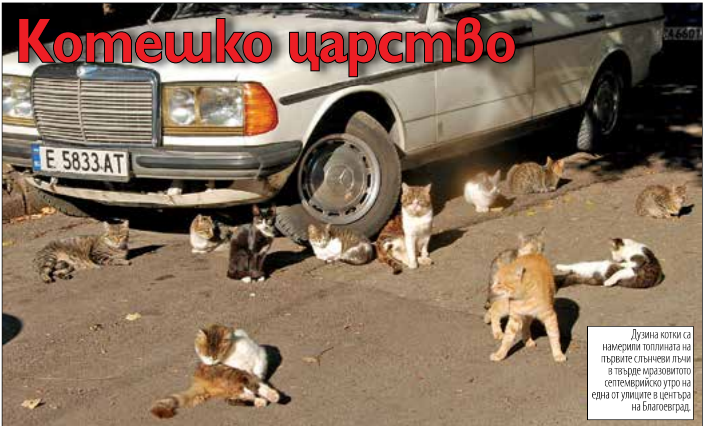
Дузина котки са намерили топлината на първите слънчеви лъчи в твърде мразовитото септемврийско утро на една от улиците в центъра на Благоевград.