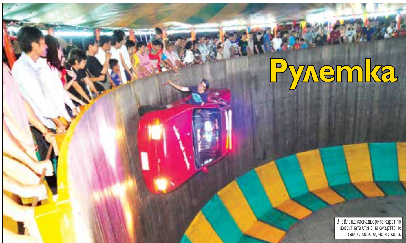
В Тайланд каскадьорите карат по известната Стена на смъртта не само с мотори, но и с коли.

>>ПРЕЗИДЕНТЪТ, КОЙТО ОСВЕН ИРЛАНДСКА ПАСТИРКА Е БИЛ И АСТРОЛОГ, ПОСЛУША КАКВО МУ СЕ ДАВА ОТ ЗВЕЗДИТЕ; ДРУГ ДА МИСЛИ ЗА ЗАЕМИ, БЮДЖЕТИ И КТБ