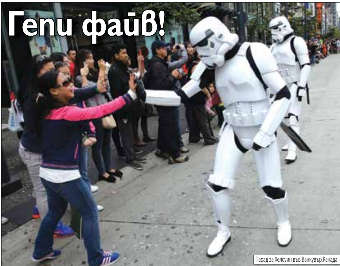
Парад за Хелоуин във Ванкувър, Канада.