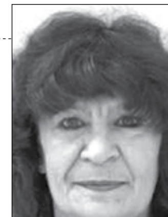
9821755, или в най-близкото поделение на МВР.

ръст, с дълга до раменете коса и зелени очи. Била е облечена със сиво палто, кафяви джинси и бели маратонки. Носела е платнена пазарска чанта с дрехи. Жената страда от болестта на Алцхаймер. Умоляват се хората, които разполагат с повече информация, да сигнализират на телефони: 112, 9821760,