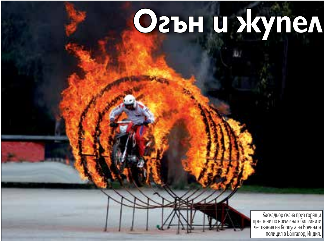
Каскадьор скача през горящи пръстени по време на юбилейните чествания на Корпуса на Военната полиция в Бангалор, Индия.