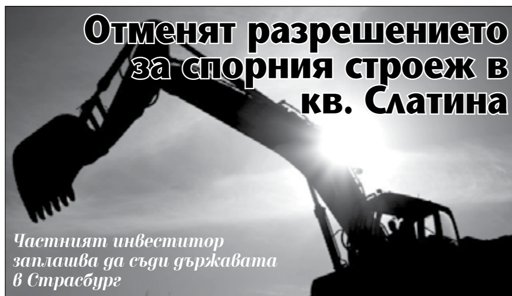
Частният инвеститор заплашва да съди държавата в Страсбург