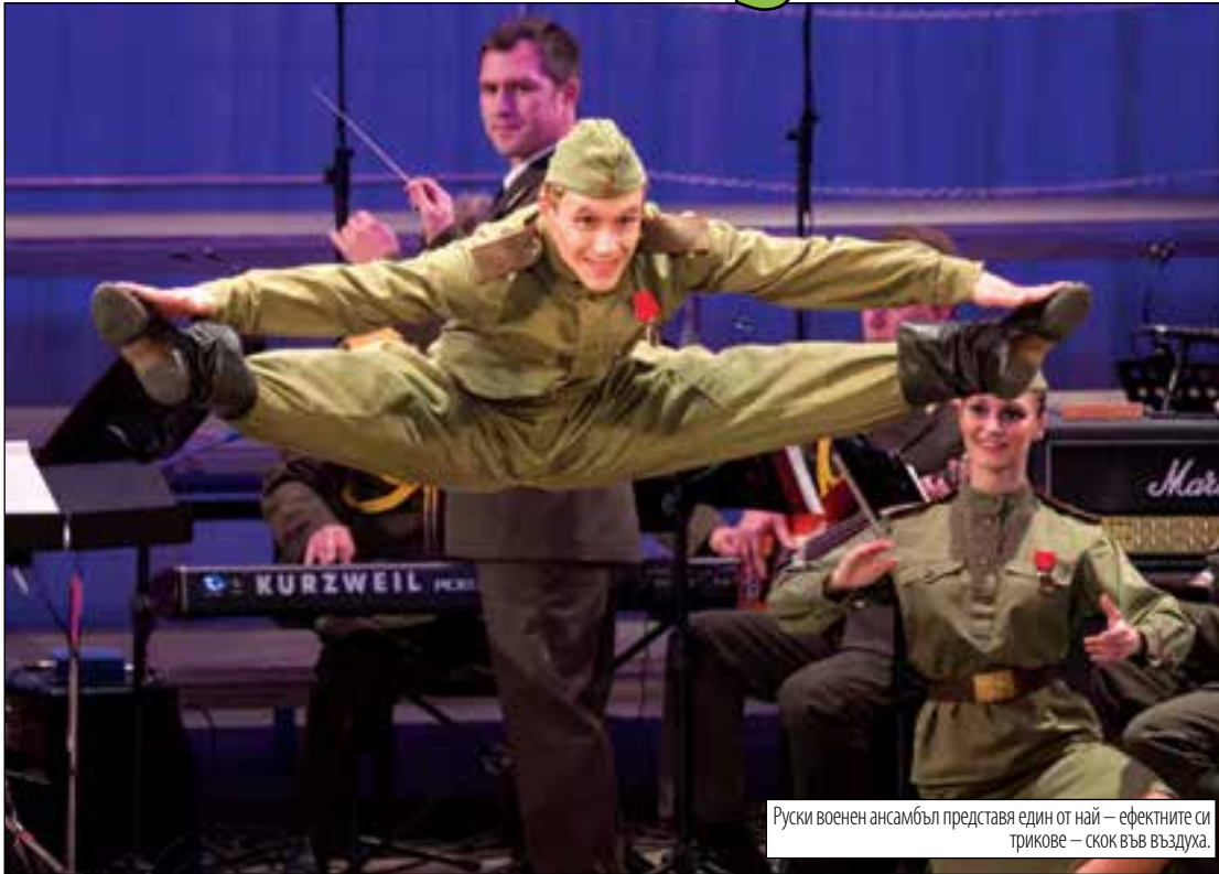
Руски военен ансамбъл представя един от най – ефектните си трикове – скок във въздуха.